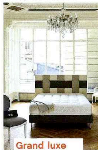
Simmons - Dunlopillo; Maison de la Literie; Tempur-Pedic Ltd; Tréca

La laine vierge, le mohair, le cachemire et la soie pour la face hiver; le coton, le lin et la soie pour la face été, ce matelas est confectionné avec les matières les plus nobles et son plateau est entièrement capitonné à la main. Disponible en trois niveaux de fermeté. 160 x 200 cm. Prix : 2 254 €. Modèle : Exclusive Air Spring®, Tréca